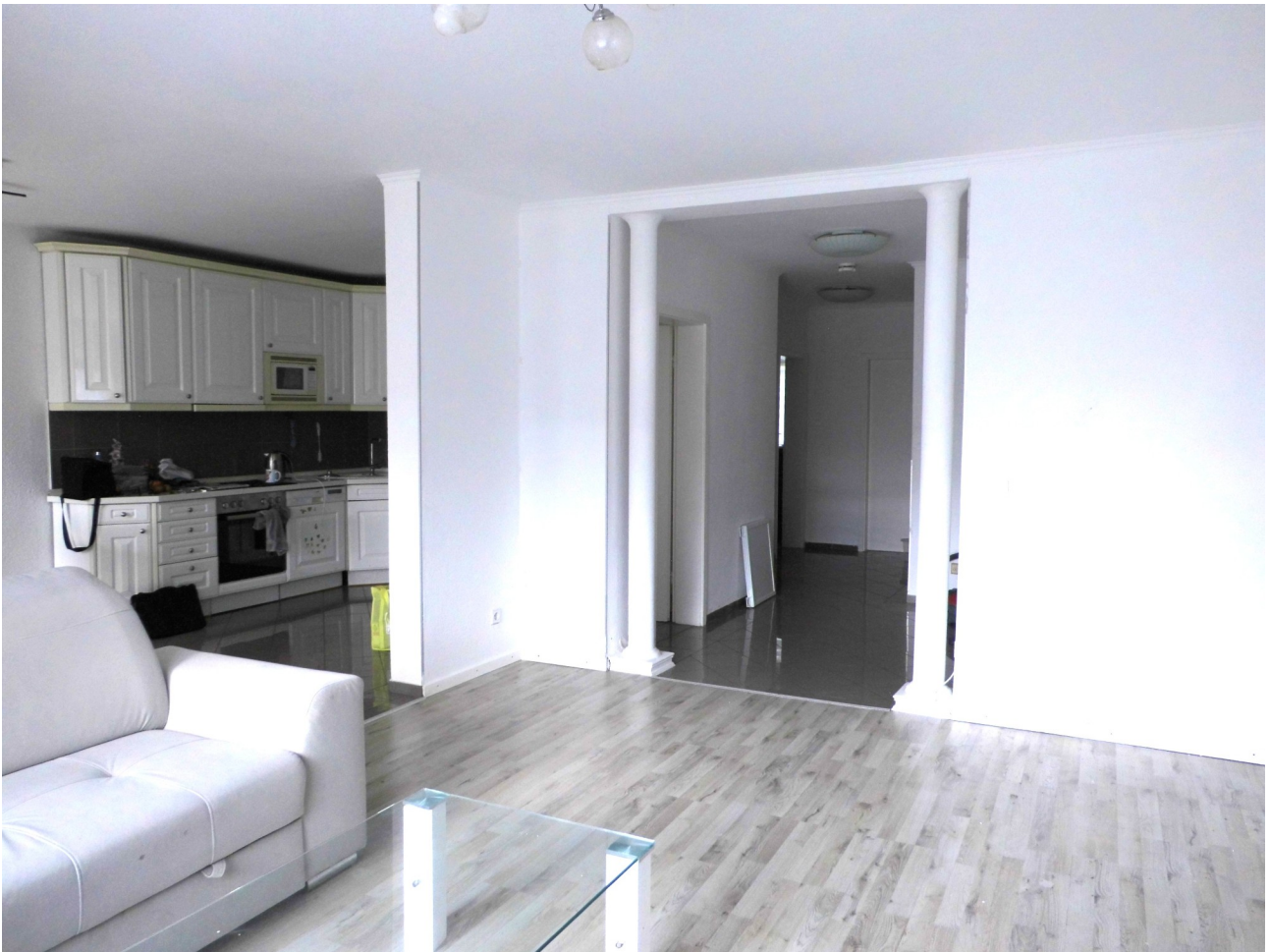
Moderner offener Schnitt