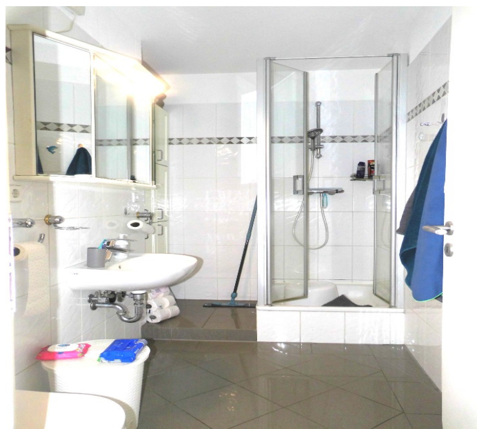
Badezimmer und Loggia.